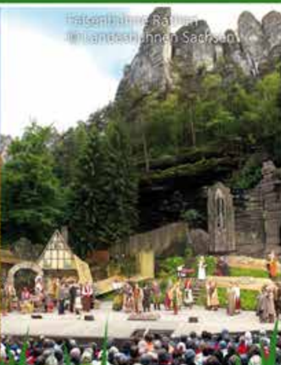
Felsenbühne Rathen