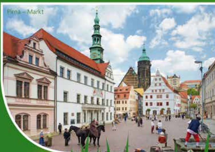
Pirna – Markt