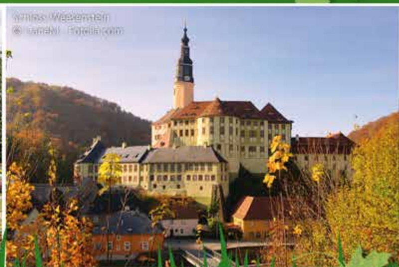
Schloss Weesenstein