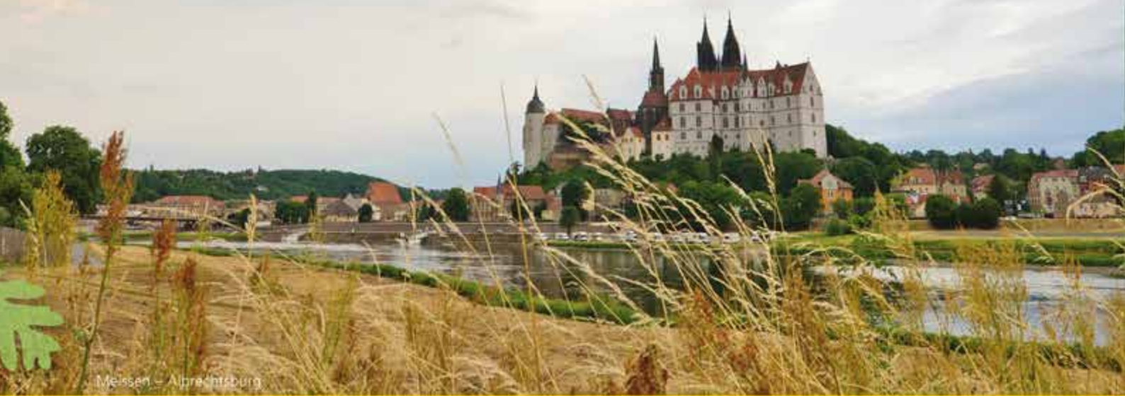
Meissen – Albrechtsburg

Ein Besuch im elbabwärts gelegenen Meißen lohnt sich für Besucher zweifach. Die malerische Stadt ist vor allem für ihre Porzellan-Manufaktur bekannt, die interessierte Gäste durch ein Museum mit Schauwerkstätten in 300 Jahre Porzellan-geschichte entführt. In der manufakturierten Boutique können Sie sich ein Schmuckstück als Andenken mit nach Hause nehmen.