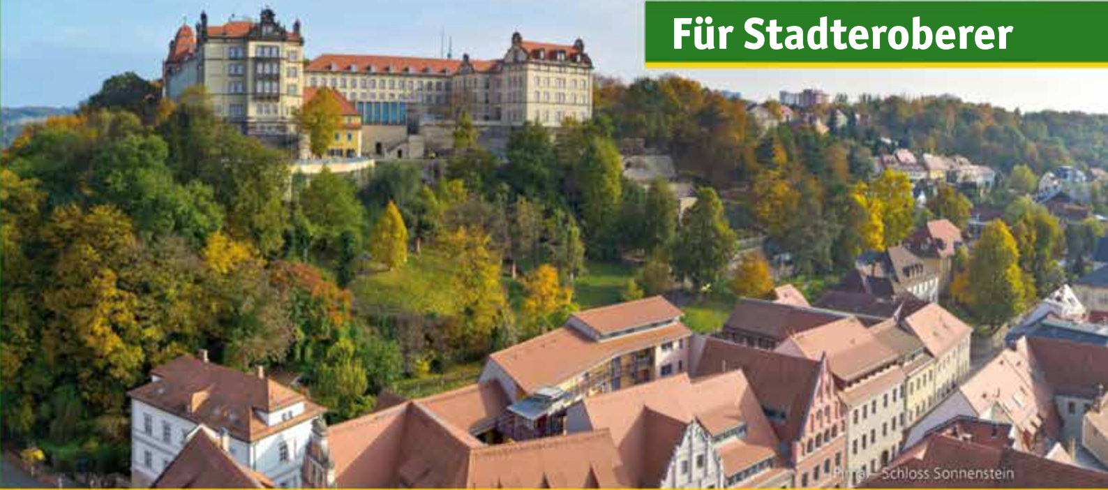
Pirna – Schloss Sonnenstein

Die zentrale Lage des Platzes bietet viele Ausflugsmöglichkeiten: In 3 km Entfernung befindet sich das historische Stadtzentrum von Pirna, dessen Highlight – das Schloss Sonnenstein – regelmäßig Besucher in seinen Bann zieht. Seit 2012 stehen die Bastionen und Wehranlagen des 18. Jahrhunderts sowie die Terrassengärten des 19. Jahrhunderts für Besucher zur Besichtigung offen. Abwechslungsreiche und vielfältige gastronomische Angebote laden im Anschluss daran Neugierige und Feinschmecker gleichermaßen zum Verweilen ein und runden Ihren Tagesbesuch in Pirna ab.