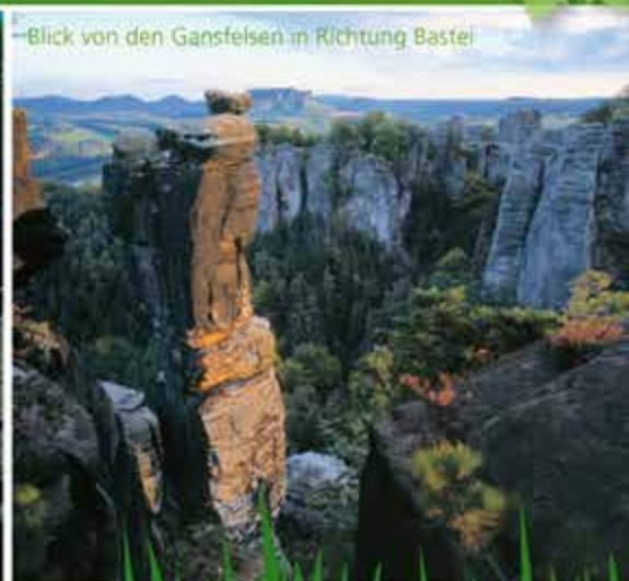
Blick von den Gansfelsen in Richtung Bastei