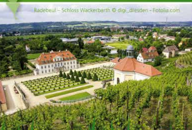
Radebeul – Schloss Wackerbarth

sowie für sein deutsches und sorbisches Kulturleben berühmt. Ein Rundgang durch die Altstadt mit Abstechern in Kirchen, Museen, Galerien und Restaurants lohnt sich immer. Wir schlagen Ihnen gerne eine Route vor!