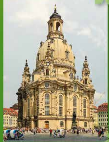
Dresden – Frauenkirche

Wer nach dem Tagesausflug in Pirna erst so richtig auf den Geschmack gekommen ist, dem empfehlen wir einen Besuch der 20 km entfernten Kultur- und Landeshauptstadt Dresden. Durch die verkehrstechnisch gute Anbindung des Campingplatzes ist ein Besuch zu jeder Zeit mit dem Auto oder der S-Bahn im 20-Minuten-Takt möglich. Schlendern Sie durch den historischen Stadtkern, bestaunen Sie den prachtvollen barocken Kuppelbau der Frauenkirche oder verweilen Sie in einem der wunderschönen, individuellen Cafés und Restaurants.