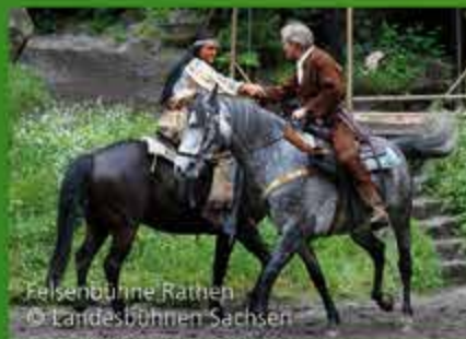
Felsenbühne Rathen

sische Schweiz befindet sich Europas schönste Naturbühne, die Felsenbühne Rathen. Zwischen Mai und September finden hier bis zu 90 Veranstaltungen der Landesbühnen Sachsen statt. Fragen Sie an der Rezeption einfach nach dem aktuellen Spielplan.